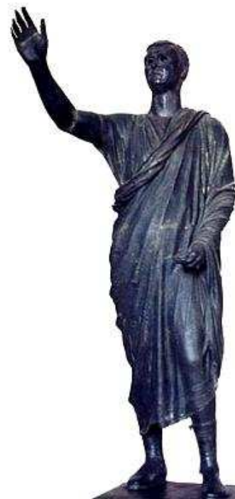
Anne Fillon, novembre 07